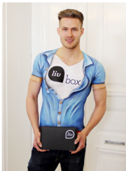
Body painting logolla PR-tilaisuuteen.