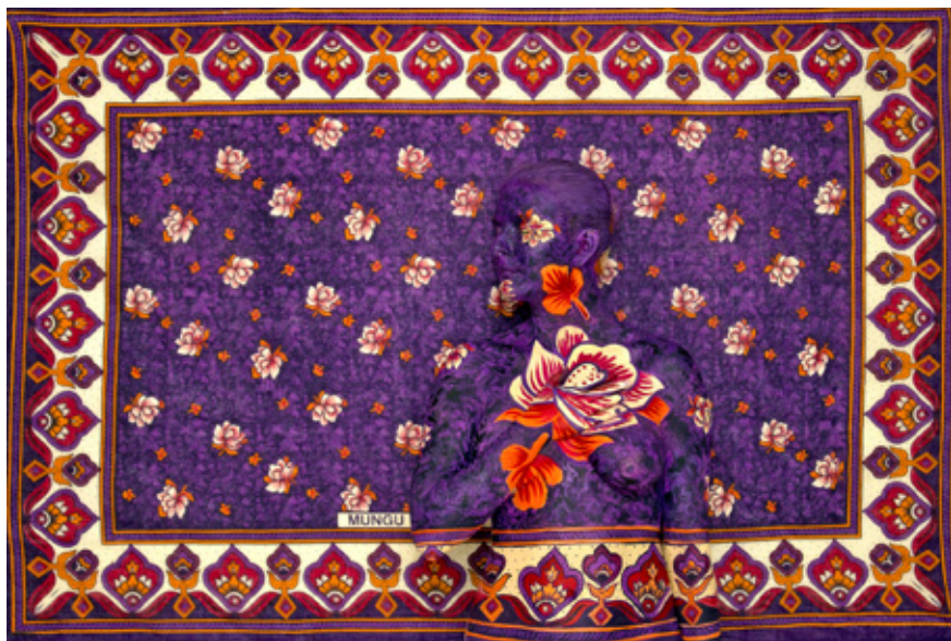
Camouflage body painting teos "Pray".

Vuonna 2013 Riina oli MM-kisoissa jo toisella sijalla ja viime vuonna hän voitti body paintingin maailmanmestaruuden festivaalin pääsarjassa, jossa oli 80 kilpailijaa 39 eri maasta. ■