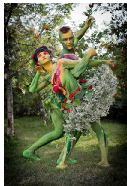
Puutarhan henget -performanssi. Lepaa 2014. Body painting Riina Laine ja photo Pinja Bruu.